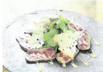
牛モモ肉の和風カルパッチョ焼きパルメザンチーズ添え