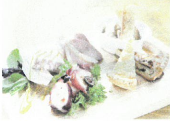
前菜の盛り合わせ 5種