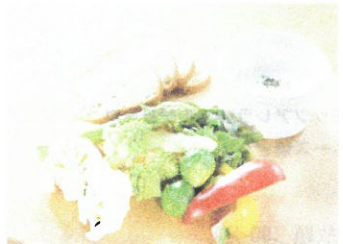
新鮮野菜のもろみ味噌バーニャカウダー