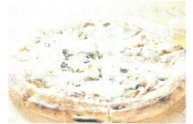
生ハムとバジルペーストのサラダピッツア 4種のチーズのピッツア クワトロフォルマッジオ