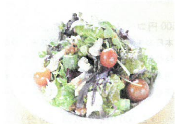
島根県邑南町郷土料理 ちしゃもみ栗スタイル